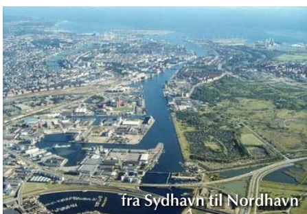
fra Sydhavn til Nordhavn