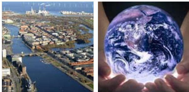
Agendacenter Indre By/Christianshavn har til opgave at støtte en bæredygtig udvikling af bydelen.

Der er flere informationer om Agenda 21 og centerets dannelse på www.a21.dk .