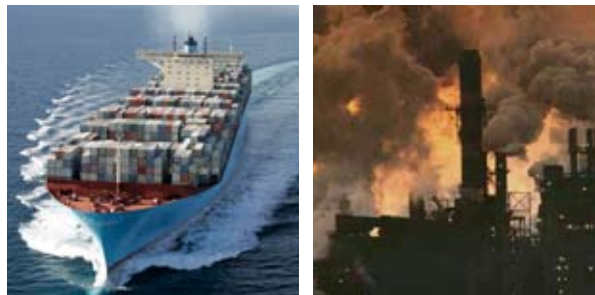
I det bæredygtige samfund må vi opretholde vores livskvalitet med en tiendedel af det nuværende ressourceforbrug.

Hvis ikke du får set The Story of Stuff på Klimafestival 2008, kan den ses på www.a21.dk/blog .